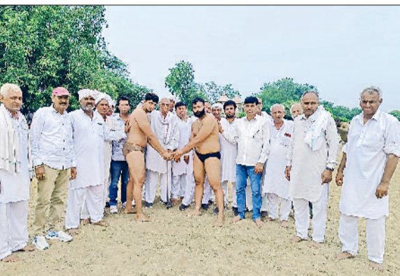
झज्जर। कुशती दंगल में पहलवानों के हाथ मिलवाते आयोजक समिति सदस्य।