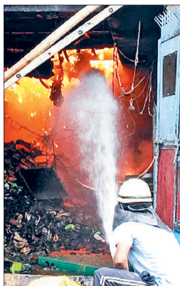
बहादुरगढ़। आग बुझाने में जुटे दमकलकर्मी।