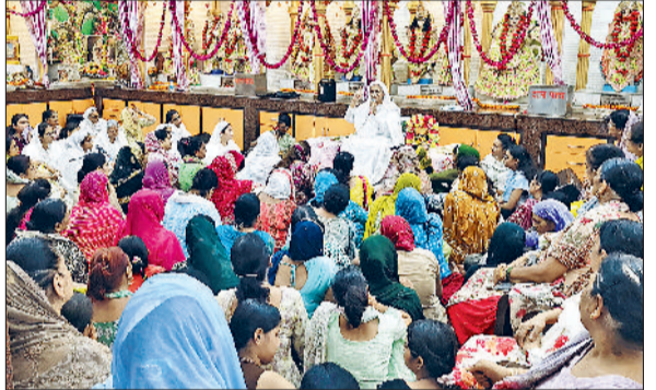
झज्जर। श्रद्धालुओं को संबोधित करते हुए कांता देवी महाराज।

को फांसी देकर ऐसी मिसाल कायम की जानी चाहिए कि भविष्य में किसी बेटी के साथ इस तरह की वारदात न हो।