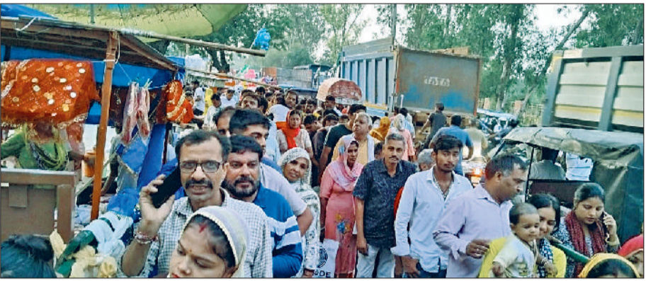
झज्जर। मेले में जाहरवीर गोगा जी के दर्शनों के लिए कतारबद्ध श्रद्धालु।

श्रद्धालुओं ने गोगा नवमी के चलते अलसुबह उठकर नवमी के प्रसाद के रूप में खीर-चूरमा व गुलगुले आदि व्यंजन तैयार किए। इसके उपरांत विधिवत बाबा जाहरवीर को भोग लगाया। शहरी क्षेत्र में शाम के समय रेवाड़ी रोड स्थित गोगा जाहरवीर की मंटी पर मस्था टेक घर में बनाया गया प्रसाद व शक्कर सिरनी चढ़ाते हुए श्रद्धालुओं ने परिवार की सुख-समृद्धि की कामना की। मेले में जहां बच्चों ने खिलौनों की खरीददारी की। श्रद्धालुओं को बाबा के दर्शनों के