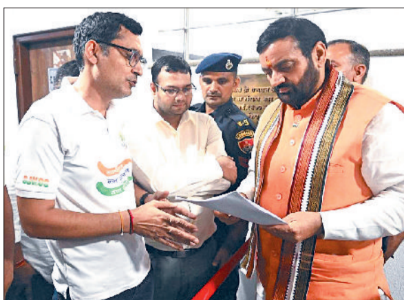
बहादुरगढ़। मुख्यमंत्री को अपनी समस्या बताते सांखोल के ग्रामीण।

संघर्षशील जनकल्याण सेवा समिति के प्रतिनिधि मंडल ने मुख्यमंत्री नायब सैनी से मुलाकात की। उन्हें गांव की समस्याएं बताते हुए समाधान की मांग की। समिति ने मुख्यमंत्री के समक्ष गांव में नए स्कूल का यथाशीघ्र निर्माण और मल्लाह तालाब के पुनरुद्धार का मुद्दा उठाया। समिति सदस्यों ने बताया कि गांव के सरकारी स्कूल में बच्चों की संख्या अधिक होने के कारण इसे डबल शिफ्ट में चलाना पड़ रहा है, जबकि भवन जर्जर और कंडम स्थिति में है। कभी भी हादसा हो सकता है। उन्होंने कहा कि स्कूल निर्माण के लिए विभागीय बजट पास हो चुका है और चुनाव से पहले