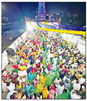
झज्जर। जन्माष्टमी उत्सव में उमड़ी श्रद्धालुओं की भीड़।