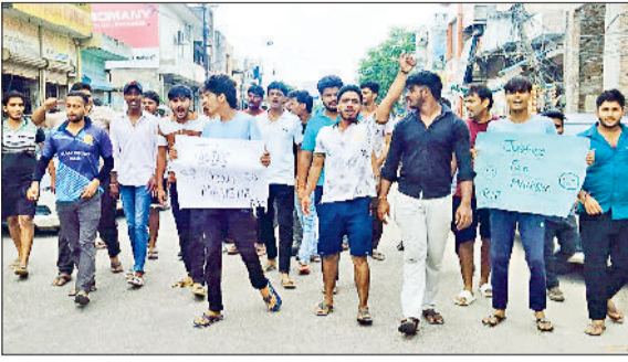
झज्जर। शहर की सड़कों पर रोष प्रदर्शन करते हुए युवा।