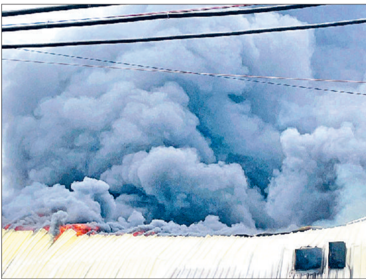
बहादुरगढ़। आग लगने के बाद फैक्ट्री से उठता धुआं।

बहादुरगढ़, दिल्ली सहित कई जगह की दर्जनभर दमकल गाड़ियां आग बुझाने के लिए बुलानी पड़ी, श्रमिक न होने से बड़ा हादसा टला