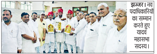
झज्जर। नव पदाधिकारियों का सम्मान करते हुए यादव महासभा सदस्य।