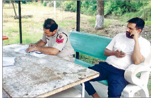
झज्जर। पोस्टमार्टम के लिए कागजी कार्रवाई करते हुए पुलिस।