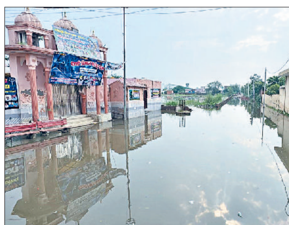
बहादुरगढ़। जाखोदा में मंदिर के बाहर गली में जलभराव।

दरअसल, गांव के शिव मंदिर और सरकारी स्कूल वाली गली में लंबे समय से जलभराव की समस्या गहराई हुई है। निकासी ठप होने के कारण पानी मुख्य गली में जमा है। इससे न तो श्रद्धालु मंदिर पहुंच पा रहे हैं और न ही बच्चे आसानी से स्कूल जा पाते हैं। ग्रामीणों ने बताया कि पिछले लंबे समय से यह समस्या गहराई हुई है। मोटर से पानी निकाला जाता है। अब तो उससे भी नहीं निकाला गया। बिन बरसात के भी यहां जलभराव रहता है और बरसात होने पर स्थिति गंभीर हो जाती है।