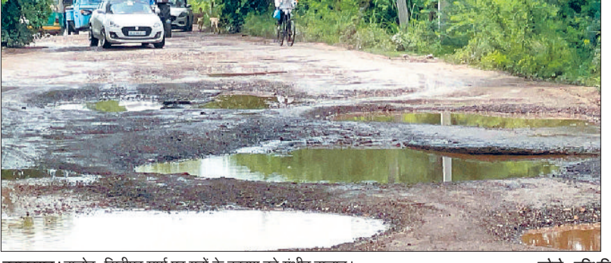
बहादुरगढ़। बालोर-सिद्धीपुर मार्ग पर गड़्डों के कारण बने गंभीर हालात।

बालोर से सिद्धीपुर लोवा की ओर जाने वाले मार्ग की हालत बेहद खराब है। सड़क में गड़ड़े हैं या गड़्डों में सड़क, यह पहचानना मुश्किल हो गया है। हालात इतने गंभीर हैं कि मार्ग पर वाहन चलाना तो दूर, पैदल निकलना भी जान जोखिम में डालने जैसा है। आए दिन दुर्घटनाएं